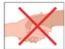
4. Geef geen hand.