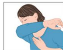
3 Nies en hoest in je elleboog.