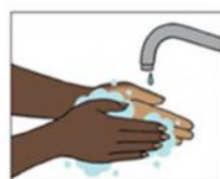
1 Was je handen een paar keer per dag met zeep. Was ook goed tussen je vingers.